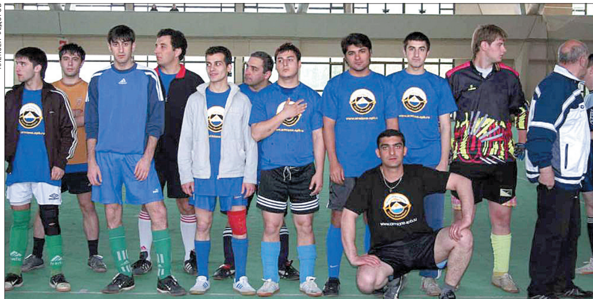
Команда «Армянского землячества» выиграла Кубок губернатора по мини-футболу между национальными общинами города

В начале 30-х годов XVIII в. на Васильевском острове существовала Армянская улица.